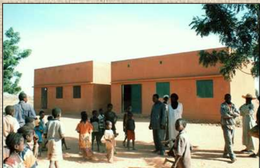
Vue des 2 seules classes en dur