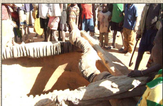
Un des 2 puits qui devra être consolidé