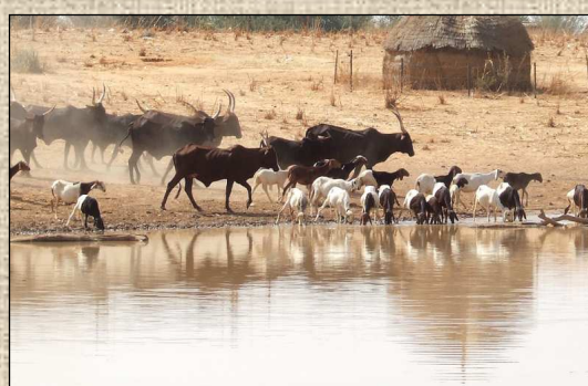
Le bétail est souvent la seule richesse