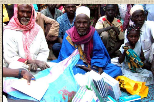
Remise de manuels scolaires par l'association