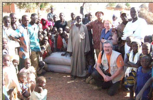
Don de 2 sacs de mil par l'association