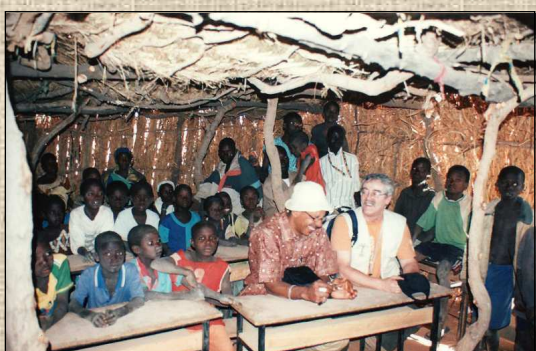
Salle de classe à l'état de paillote