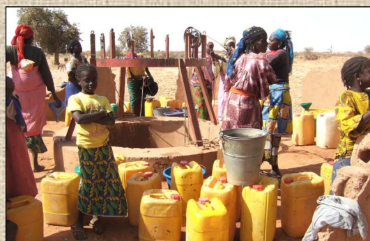
Corvée d'eau pour les familles